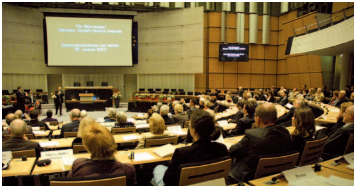
Im Plenarsaal war jeder Stuhl besetzt.

Zusätzlich gründete er 2002 mit anderen Mitstreitern den „AK Antisemitismus“ in Minden, der u.a. die antisemitische Hetze Adolf Stoeckers, des Hofpredigers und des Gründers der Berliner Stadtmission, in die Öffentlichkeit brachte und es erreichte, dessen Namenspatronat eines Gemeindehauses in der Mindener Region aufzuheben. 2003 weihte die AGASP in der Synagoge das Informations- und Dokumentationszentrum zu über 450 Jahren jüdischer Orts- und Regionalgeschichte mit einer Ausstellung von neun Vitrinen ein. Battermann organisierte und betreut seitdem einen ehrenamtlichen ganzjährigen sonntäglichen Aufsichtsdienst durch Mitglieder der AGASP und bietet seit