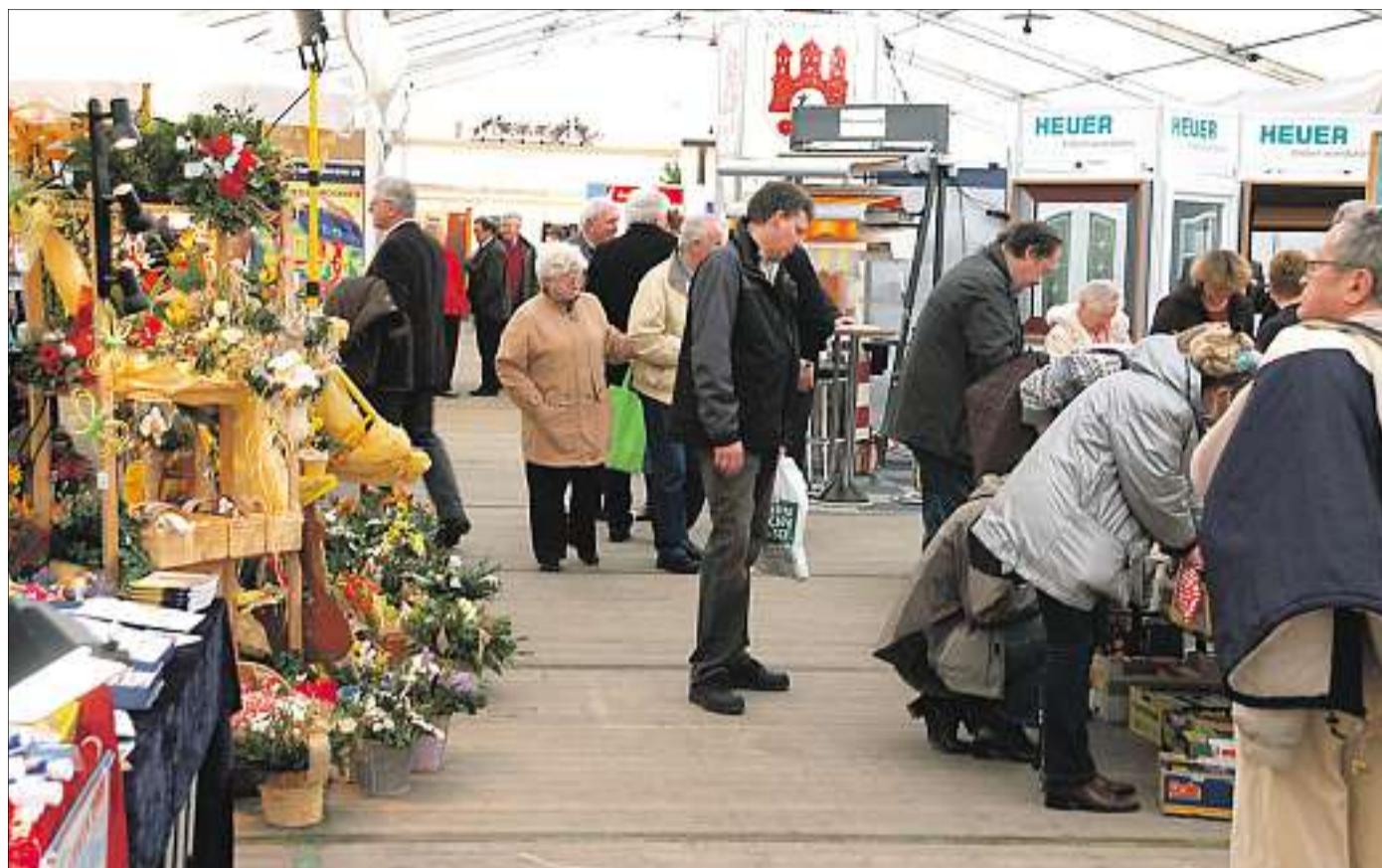
Die Rehburger Wirtschaftsschau zieht auch Aussteller und Besucher an, die weit über die Grenzen der Stadt und des Landkreises hinaus beheimatet sind.

17. März ab 13 Uhr und am 18. März ab 11 Uhr geöffnet. Die Ausstellung schließt an beiden Tagen gegen 18 Uhr.